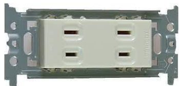
No.① コンセント (2口)