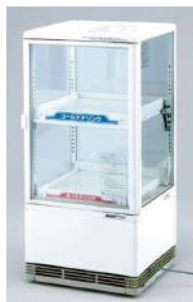
No.⑯ 卓上ショーケース