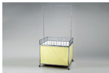
No.⑪ ワゴン (3尺)