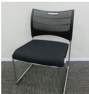
No.⑤ スタッキングチェア