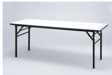
No.⑦,⑧ 会議机 (中・小)