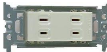
No.③ コンセント (2口)