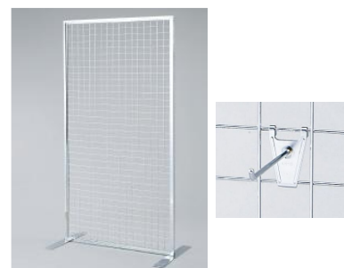
No.⑨ メッシュパネル (フック5個付き)