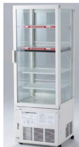
No.⑰ 4面ガラスショーケース