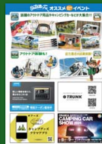
表面(前回サンプル)