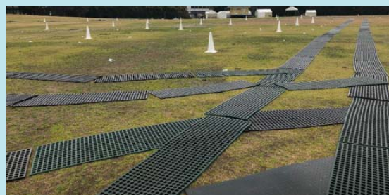
【東の広場 芝生保護マット】

特別な事情がある場合、主催者判断で上記ルールを適用しない場合があります。 芝生保護のため、ご協力のほどよろしくお願い申し上げます。